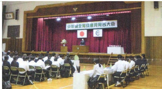
【江田島】令和5年度江田島市少年健全育成意見発表大会の開催 (10月24日)

大柿中学校体育館に市内の中学生を集め、代表者7名による意見発表大会を行いました。学校や家庭、地域社会の中で日頃の考えや感じていることなど、自由なテーマで発表を行い「価値観の違い」を題材にした能美中学校の生徒が最優秀賞に選ばれました。