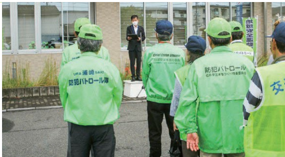
【福山西】全国地域安全運動開始式を行い結束を強化 (10月9日)

福山市西部市民センターにおいて、警察、市役所、各地区防犯ボランティア関係者等約50名が集まり、全国地域安全運動開始式を行いました。式では、地元高校の吹奏楽部員と警察官によるコラボ演奏を行い、防犯活動の士気の高揚に繋がりました。