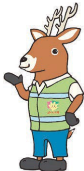
「減らそう犯罪」県民総ぐるみ運動マスコットキャラクター「モシカ」

東広島市消防局駐車場広場で行われた消防・防災フェアに、安全安心ブースを設けて、このたび更新した青パト「モシカ号」を展示しました。数百人の子供たちが乗車し、ふれあいを深めました。