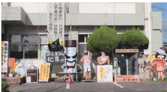
【庄原】「防犯かかし」どれが一番? (10月11日)

福山市西部市民センターにおいて、警察、市役所、各地区防犯ボランティア関係者等約50名が集まり、全国地域安全運動開始式を行いました。式では、地元高校の吹奏楽部員と警察官によるコラボ演奏を行い、防犯活動の士気の高揚に繋がりました。