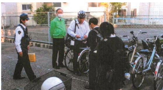
【尾道】自転車盗難防止啓発活動の実施 (10月18日)

庄原警察署の正面にユニークな防犯かかしが勢ぞろいしました。どの作品も今年活躍したタレントやキャラクターなどを使って、特殊詐欺被害防止や薬物乱用防止を呼びかけるもので、闇バイトを題材にした作品が最優秀賞に輝きました。