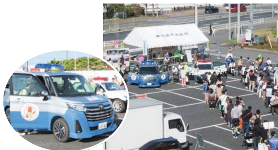
【東広島】消防・防災フェアで新型モシカ号をお披露目 (11月3日)

大柿中学校体育館に市内の中学生を集め、代表者7名による意見発表大会を行いました。学校や家庭、地域社会の中で日頃の考えや感じていることなど、自由なテーマで発表を行い「価値観の違い」を題材にした能美中学校の生徒が最優秀賞に選ばれました。